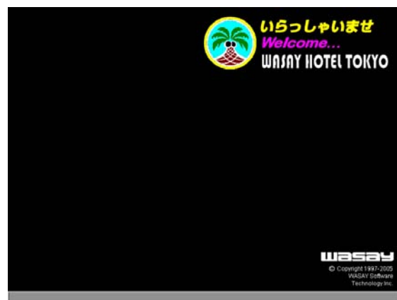
図2 オリジナルロゴ例